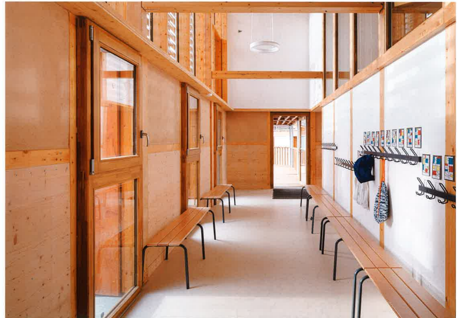
INTÉRIEUR DU PÔLE PRIMAIRE