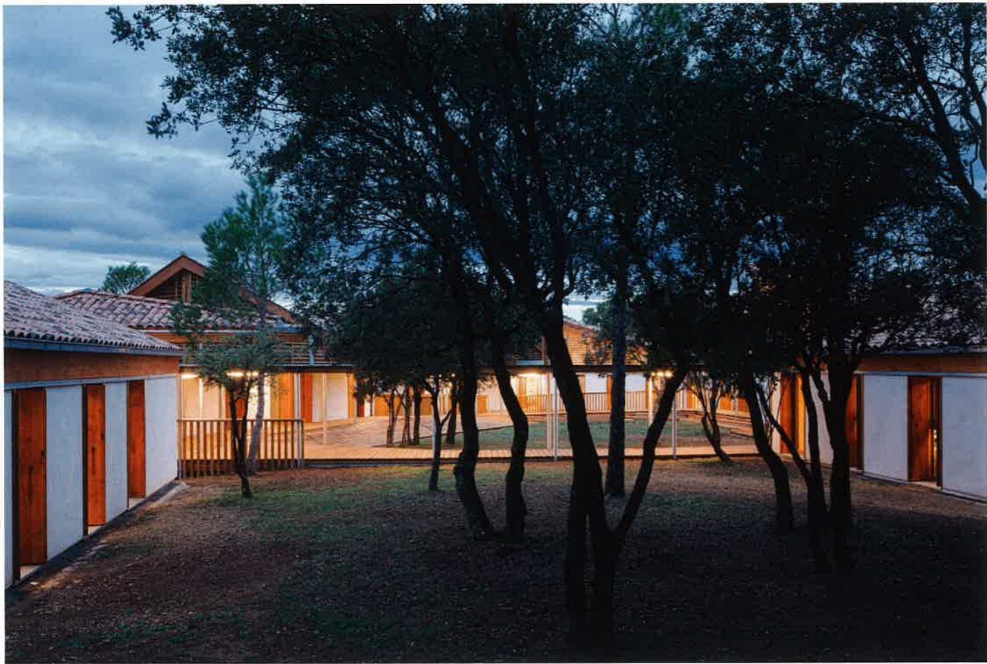
COUR DE CONTEMPLATION